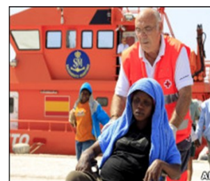
Pessoas idosas tendem a ser mais generosas.

Em um ranking de generosidade realizado pelo instituto de pesquisas Gallup o Brasil ficou em 76º lugar. A pesquisa foi feita com base em questionários, sendo 153 países participantes. A ONG Internacional Charities Aid Foundation criou o índice World Giving Index (Índice de Generosidade Mundial) e foi responsável pela pesquisa. As entrevistas foram embasadas em perguntas sobre doações para entidades, tempo gasto em trabalho voluntário e ajuda a estranhos. Em correlação aos países dos BRICs os brasileiros são os mais generosos, ficando a frente do Índia (134º), russos (138º) e chineses (147º). Já em relação a América Latina o Brasil aparece atrás de outros 15 países neste ranking da generosidade, todavia o país encontra-se empatado com a Argentina e Nicarágua. Os cinco primeiros do ranking são Austrália, Nova Zelândia, Canadá, Irlanda e Suíça, já os últimos colocados são Grécia, Sérvia, Ucrânia, Burundi e Madagascar (último).