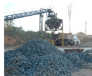
Aumento nas exportações de minério.

“O Brasil é tomado como o país que mais diversificou suas exportações nesta última década, aumentando sua participação de 13% para 20% .”